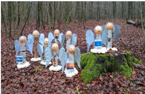
Station „Friedensengel“ gestaltet vom evangelischen integrativen Hort