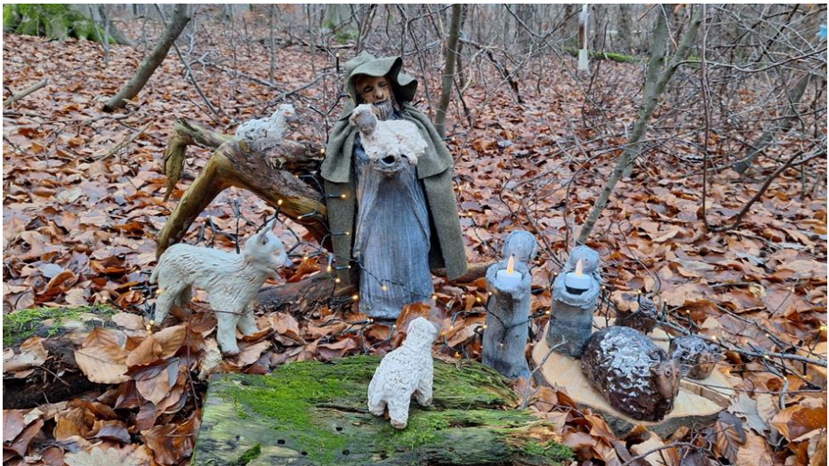
Station „Hirten auf dem Feld“ gestaltet von der Töpfer-AG des Jugendzentrums

Die Freude und Begeisterung der Gäste ist für die vielen fleißigen Helfer*innen der schönste Lohn. Allen Schulklassen, Kitas, Altenpflegeheimen, sonstigen beteiligten Gruppen, Einzelpersonen und Chören ein großes Dankeschön für die tollen Stationen und natürlich auch den Mitgliedern des Arbeitskreises „Weihnachtsweg“, die eine solche Idee realisiert haben. Alle haben gemeinsam etwas Besonderes geschaffen. Dies hat auch die Stadt Stadtallendorf anerkannt, indem sie mit den Verfügungsfonds für sozialen und kulturellen Zusammenhalt den Weihnachtsweg gefördert hat.